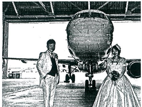
格納庫内のフォトスタジオの様子